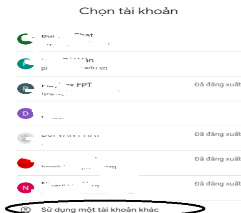
Hình 2: Thao tác chọn tài khoản (Nếu cần)

Sau đó đăng nhập hệ thống sẽ tự động quay lại trang chủ học trực tuyến Meet.