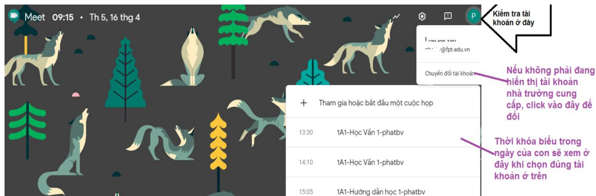
Hình 1: Sử dụng trang meet để xem lịch

Đến giờ học, Học sinh click vào buổi học, con sẽ tự động vào lớp học online.